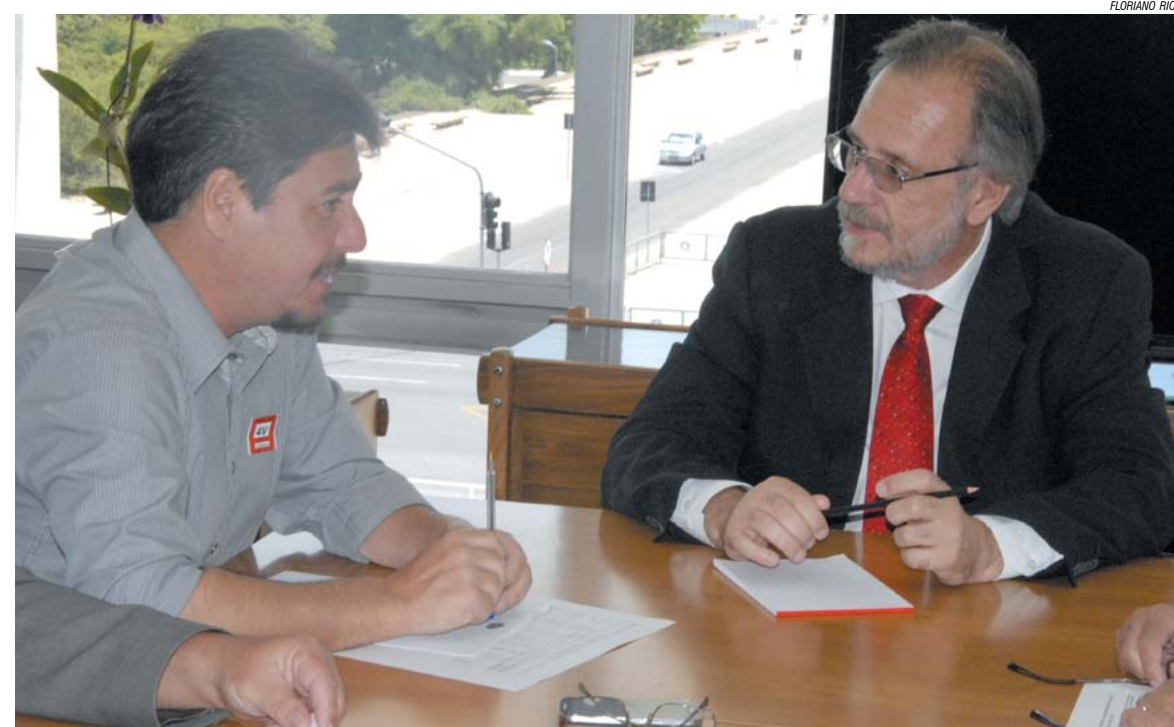
Rafael e o ministro Miguel Rossetto, em Brasília

Segundo ele, Rossetto se comprometeu a encaminhar o pedido à presidenta Dilma Rousseff e pediu a assessores